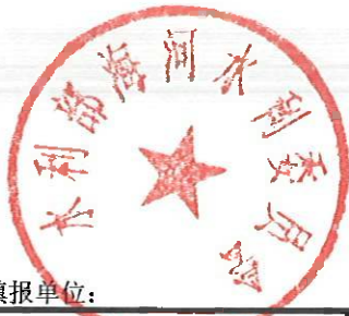
行政复议案件审理情况统计表